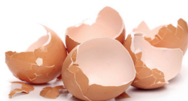
Jaja oraz skorupki jaj