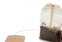
Woreczki z herbatą