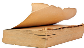
Książki w miękkiej oprawce