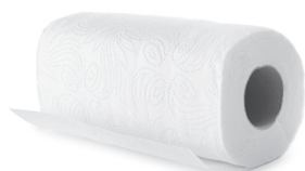
Ręcznik papierowy oraz serwetki