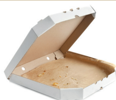
Pudełka po pizzy