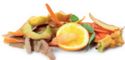
Warzywa i owoce

Ten pojemnik jest przeznaczony dla wszystkich odpadów żywnościowych z gospodarstw domowych. To bardzo ważne, aby używać tylko worków nadających się do kompostowania. Odpady wykorzystywane są do produkcji kompostu, który ma za zadanie poprawić żyzność gleby. Kompost może być wykorzystany w projektach rekultywacji terenów zdegradowanych.