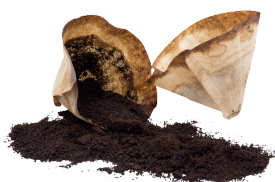
Fusy z kawy oraz filtry