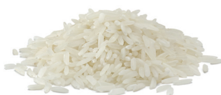
Ryże i kasze