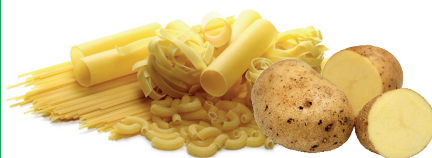
Makaron i ziemniaki