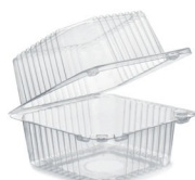
Tacki plastikowe z pokrywką